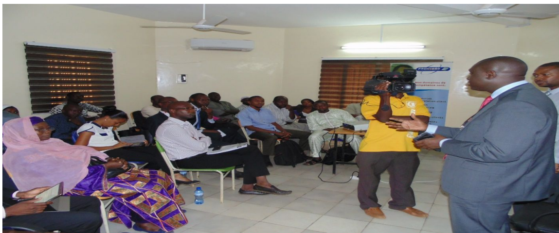
Figure 6: intervention du DG d'Orange Niger au Bootcamp entrepreneuriat social et TIC

Le centre Incubateur des Petites et Moyennes Entreprises au Niger (CIPMEN) a organisé le mardi 26 Août 2014 un Bootcamp dont le thème portait sur « les TICs au service de l'entrepreneuriat Social ». Cette journée de formation et de partage avait