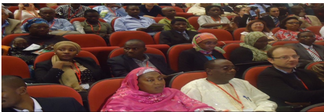
Figure 5: Cérémonie de clôture du FIJEV 2014 au palais des congrès

Du 10 au 15 juin 2014 s'est tenu à Niamey le Forum International Francophone Jeunesse et Emploi Verts (FIJEV). Au cours de cette deuxième édition, plus de 200