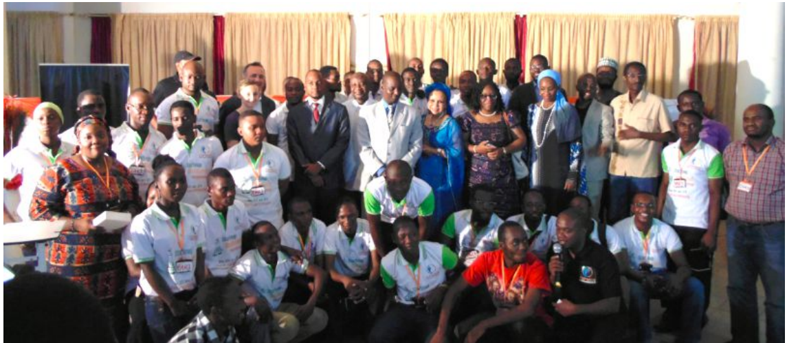
Figure 2: Photo de famille du Startup weekend Niamey 2014

La première édition a eu lieu du 25 au 27 Avril 2014 au CIPMEN. Elle a regroupé une quarantaine de jeunes porteurs de projet. Un weekend très riche en partage d'idées, co-working, détente mais surtout de belles rencontres professionnelles. Les équipes ont donné le meilleur d'elles-mêmes pendant 54h afin de séduire le jury. Sept équipes ont été sélectionnées pour présenter leurs projets. Au final, trois projets ont été primés et un quatrième projet a reçu l'encouragement du Jury. Les quatre projets bénéficient de la pré-incubation au CIPMEN.