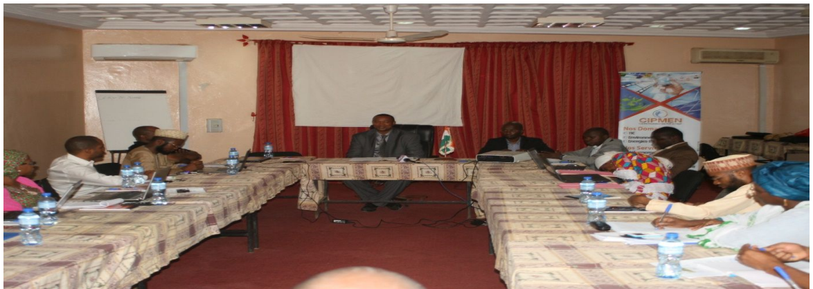
Figure 3: participants à l'atelier présidé par le Haut-commissaire à la modernisation de l'état