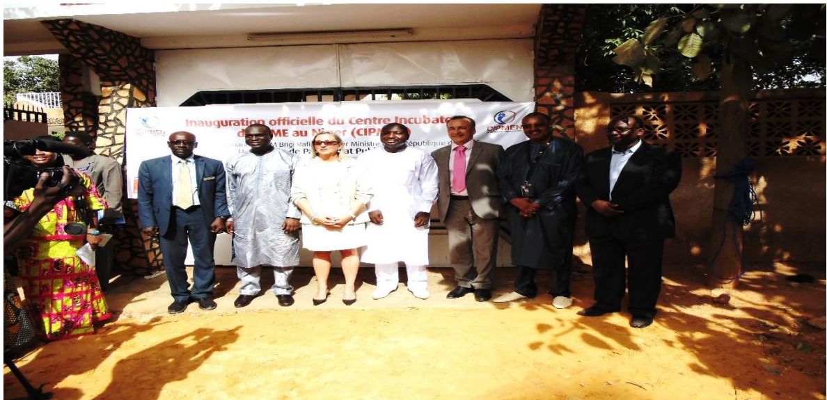
Figure 1 : Quelques partenaires du CIPMEN