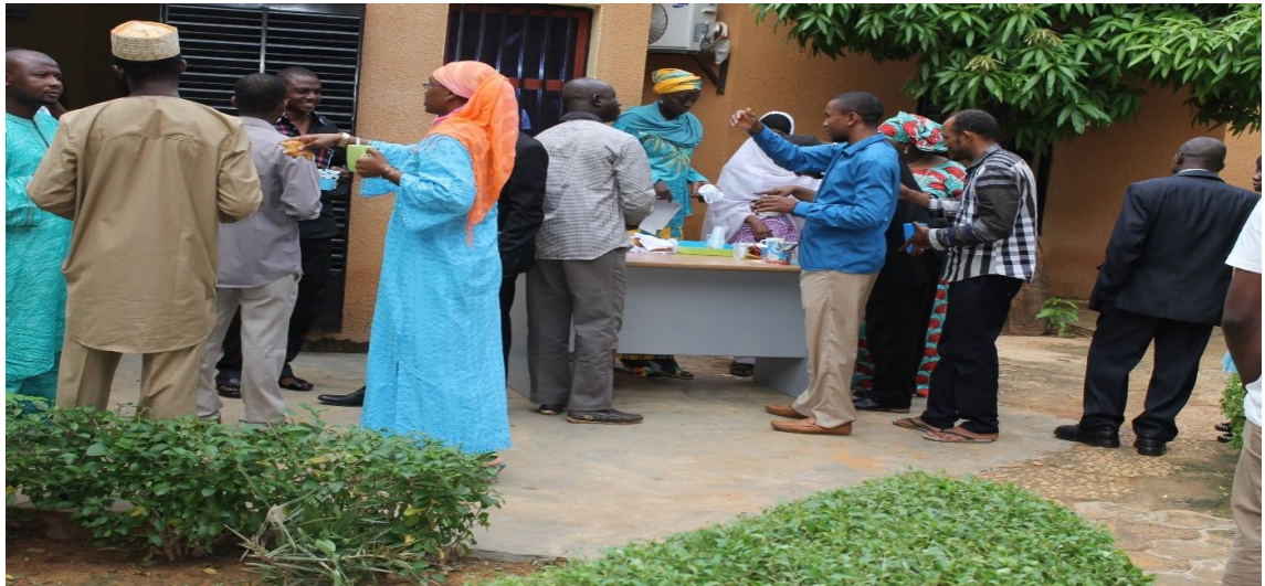
Figure 7 : Les rencontres du vendredi

Le CIPMEN et les entreprises incubées organisent un petit déjeuner chaque vendredi de 9h à 10h. Cette rencontre a pour but de favoriser les échanges d'idées sur des thèmes pouvant aider dans la gestion d'entreprise.